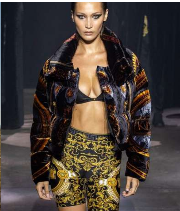
KITH BY VERSACE